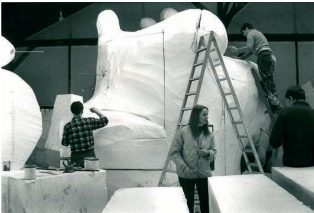
Niki de Saint Phale