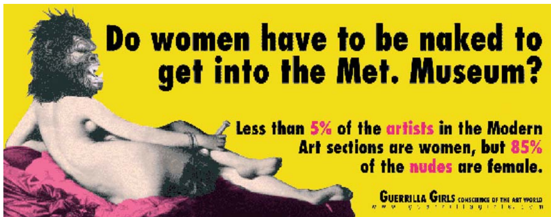
Guerrilla Girls, "Get Naked", 1989