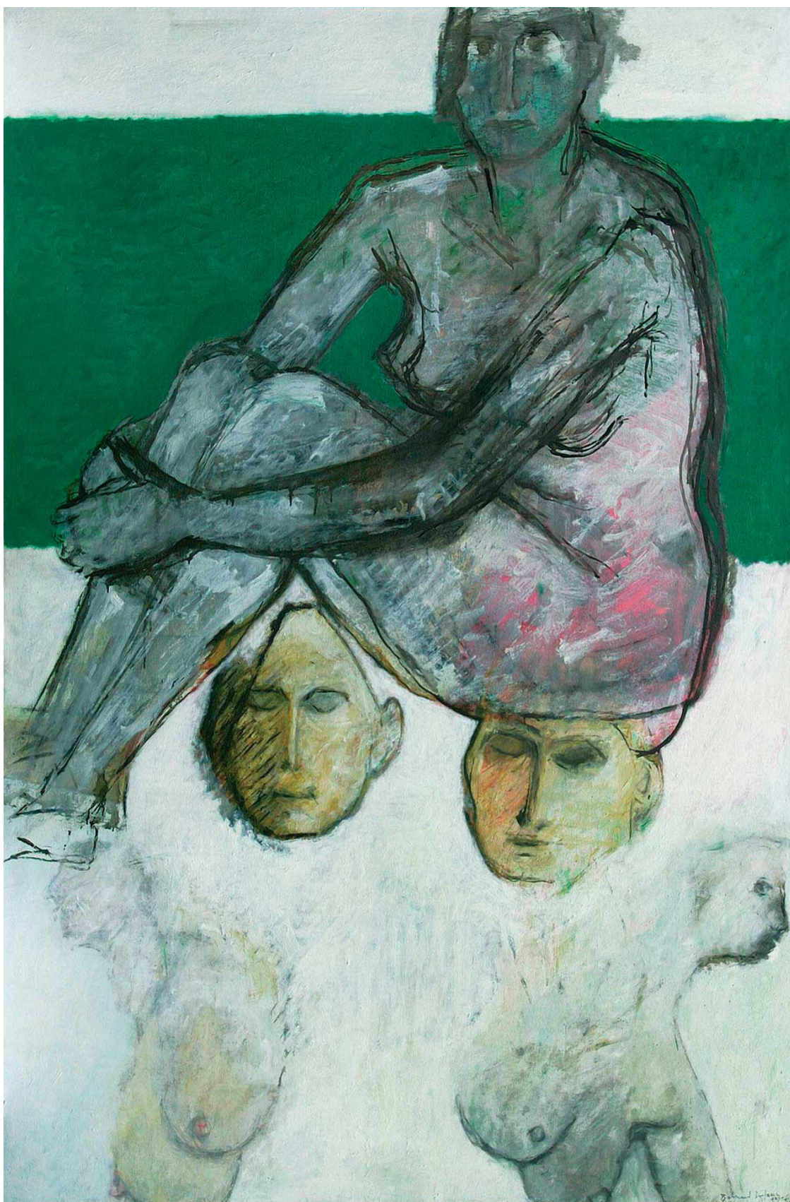
Huile sur toile de Bernard DUFOUR