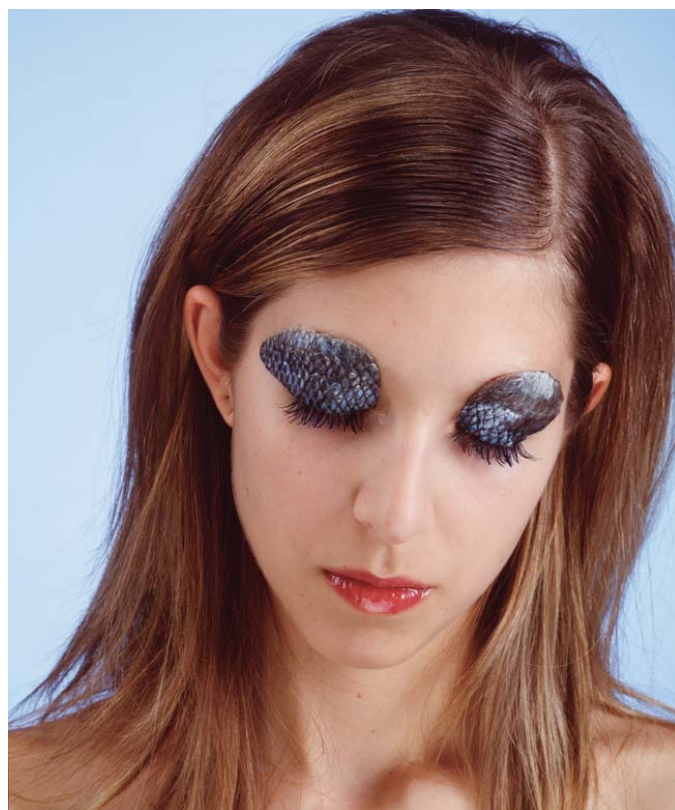
Natacha Lesueur Sans titre 2000 Ilfochrome contrecollé sur aluminium, sous diassec 102,8 x 128,5 cm collection FRAC Poitou-Charentes