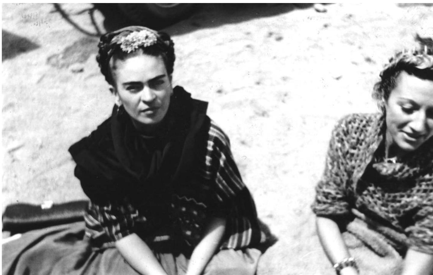
Jacqueline Lamba et Frida Kahlo